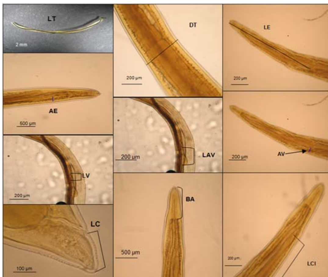
Figura 3. Características morfométricas de nemátodos ( Contraecum sp , larva en estado III) encontrados en moncholo Hoplias malabaricus de la Ciénaga Grande de Lórica. (Longitud total, LT; diámetro total, DT; longitud del esófago, LE; ancho del esófago, AV; longitud del apéndice ventricular, LAV; longitud del ventrículo, LV; ancho del ventrículo, AV; longitud ano-punta cola, LC; longitud boca-anillo nervioso, BA; longitud ciego intestinal, LCI). Microfotografías Centro de Investigación Piscícola de la Universidad de Córdoba (CINPIC), 10x y 40x.